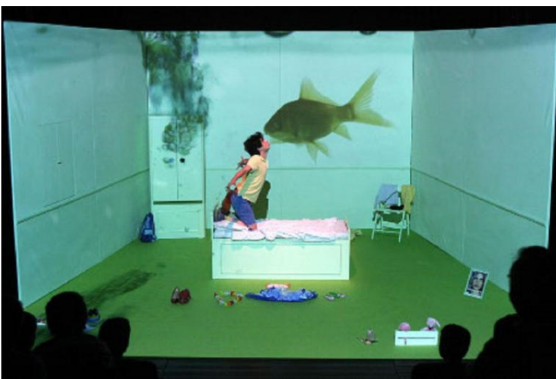
Una scena dello spettacolo, ph. Franco Lannino - Studio Camera.

impediscono una felice ricezione del lavoro di Scarpinato.