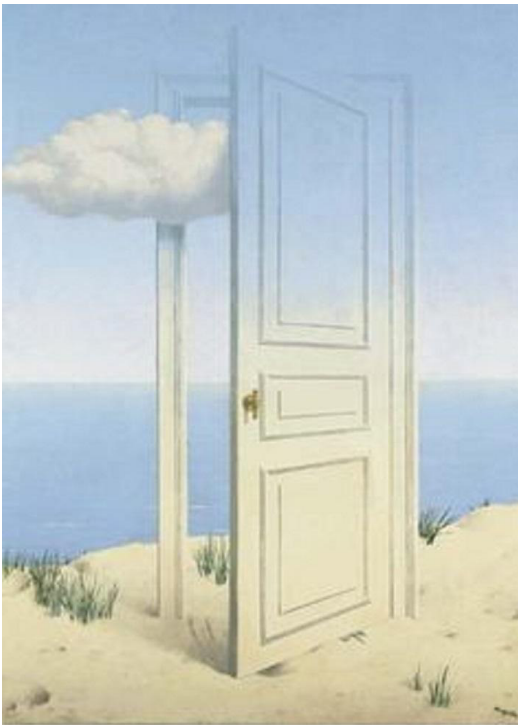
Magritte, La traversée difficile (1946).

capace di seguire tutti i percorsi di vita possibili / di attraversare tutti i luoghi della terra in un'unica volta. In questo senso, è lecito dire che Fa'afafine parla a tutti, bambini e adulti, perché costruisce un'utopia poetica: quella di abbracciare la totalità nel piccolo spazio del proprio 'io'. Piuttosto che creare confusioni sull'identità sessuale ed esporre a conseguenti pericoli per la salute psichica, Alex ci offre un proficuo invito a non trascurare una sola delle nostre proprie personalità latenti, per quanto è possibile a un essere umano. Anche questo bambino un giorno dovrà scegliere la sua occupazione (come si è accennato, magari quella dell'attore) e il luogo da abitare, ma col suo allenamento immaginativo potrà probabilmente fare una scelta meno limitante e mantenere, quanto meno, duttilità e curiosità verso l'esistente. Si potrebbe certo obiettare che, quand'anche l'interpretazione appena offerta fosse corretta, lo spettacolo risulterebbe ancora più pericoloso di quanto non sembrasse prima. Alex insegue le visioni immaginifiche rinchiudendosi in una stanza, quindi emarginandosi dalla società che lo esorta al controllo e al limite, per convivere felicemente con gli altri esseri umani. Chi si comportasse come lui vivrebbe in totale isolamento e rifiuterebbe il confronto. L'obiezione è insomma che, se il mondo può stare in una stanza, noi non abbiamo bisogno del mondo esterno e vero.