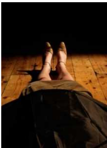
Cosmesi – pensiero beige

La storia è drammaturgia. Ormai ne sono convinto. La penso così appena giro l'angolo lungo il corridoio parrucchiere-shiatsu-biglietteria e alla fine anche la libreria "portatile" di