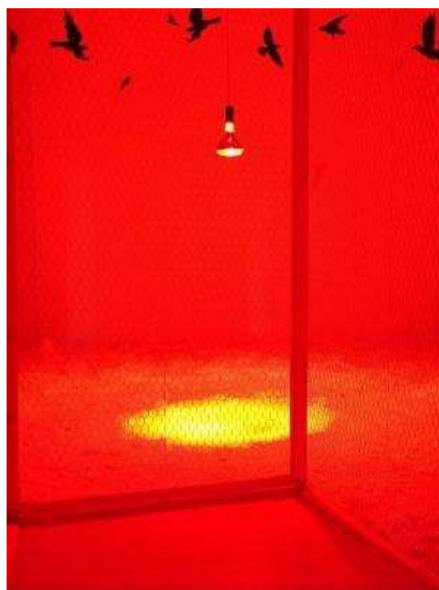
Cosmesi - Ghostrack - 2010 - courtesy NotGallery, Napoli 2010

Nella sala superiore, una rete metallica blocca l'ingresso e delimita una grande voliera, rischiarata da un sole rosso artificiale e cosparsa sul fondo di piume; all'interno, un richiamo insistente di cornacchie. Sulla parete centrale, uccelli neri volano dipinti sul muro. Un'installazione dal forte impatto, un messaggio potente e ambiguo, da mettere in tasca e portarsi dietro. Come un ammonimento, un rimprovero su cui riflettere ciascuno a proprio modo per accendere differenti possibilità: è l'uomo che è imprigionato e che sogna di volare come gli uccelli, o è il povero animale che cade nella gabbia per causa umana? Chi è la vittima e chi il carnefice? Ci appartiene di più la leggerezza insostenibile delle piume o la gravità sostenibile delle carceri? Pensieri complicati, figure semplici, sogni, paure, proiezioni differenti e personali, dove pare affiorare l'idea che ci scorge tutti in trappola, svampiti dentro un treno che non può fermarsi. L'uomo, il pennuto e pure l'arte, affogati in un periodo nero dal quale soltanto la poesia, la coraggiosa ironia e una rinnovata umanità possono tirarci fuori.