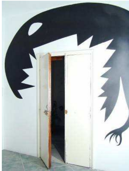
Cosmesi - Ghostrack - 2010 - courtesy NotGallery, Napoli 2010